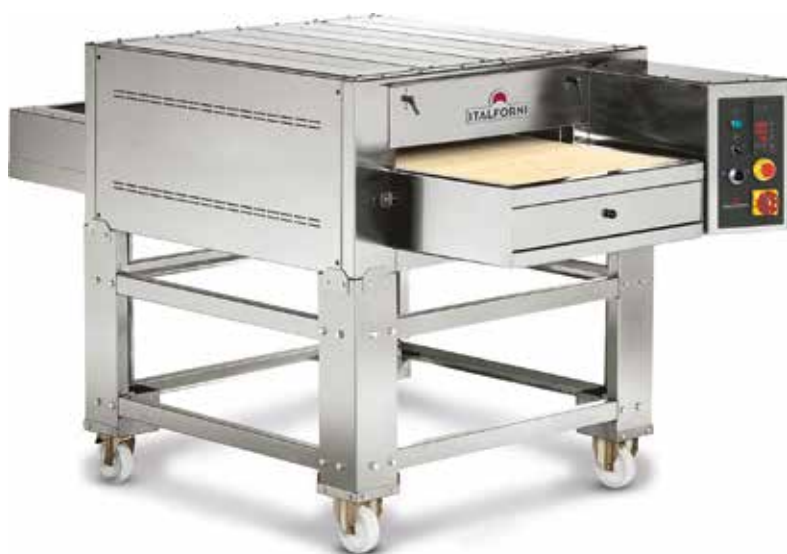
TUNNEL STONE ELETTRICO

Stainless steel shielded resistors Résistances blindées en acier Inox Gepanzerte Heizelemente aus Edelstahl Resistencias blindadas de acero inoxidable