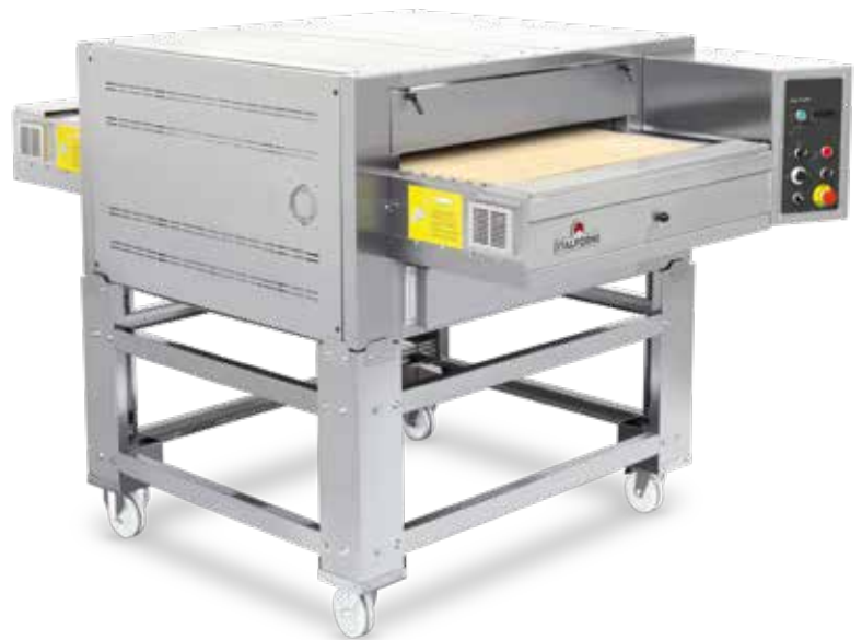
TUNNEL STONE GAS

Cinta transportadora con listones de piedra refractaria