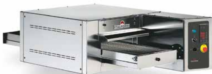
TUNNEL CLASSIC ELETTRICO

I forni TUNNEL CLASSIC e TUNNEL STONE prevedono camere di cottura con regolazione elettronica separata delle temperature del cielo e del piano cottura. Controllate ed impostate con facilità dall'operatore, consentono una cottura impeccabile per ogni tipo di alimento.